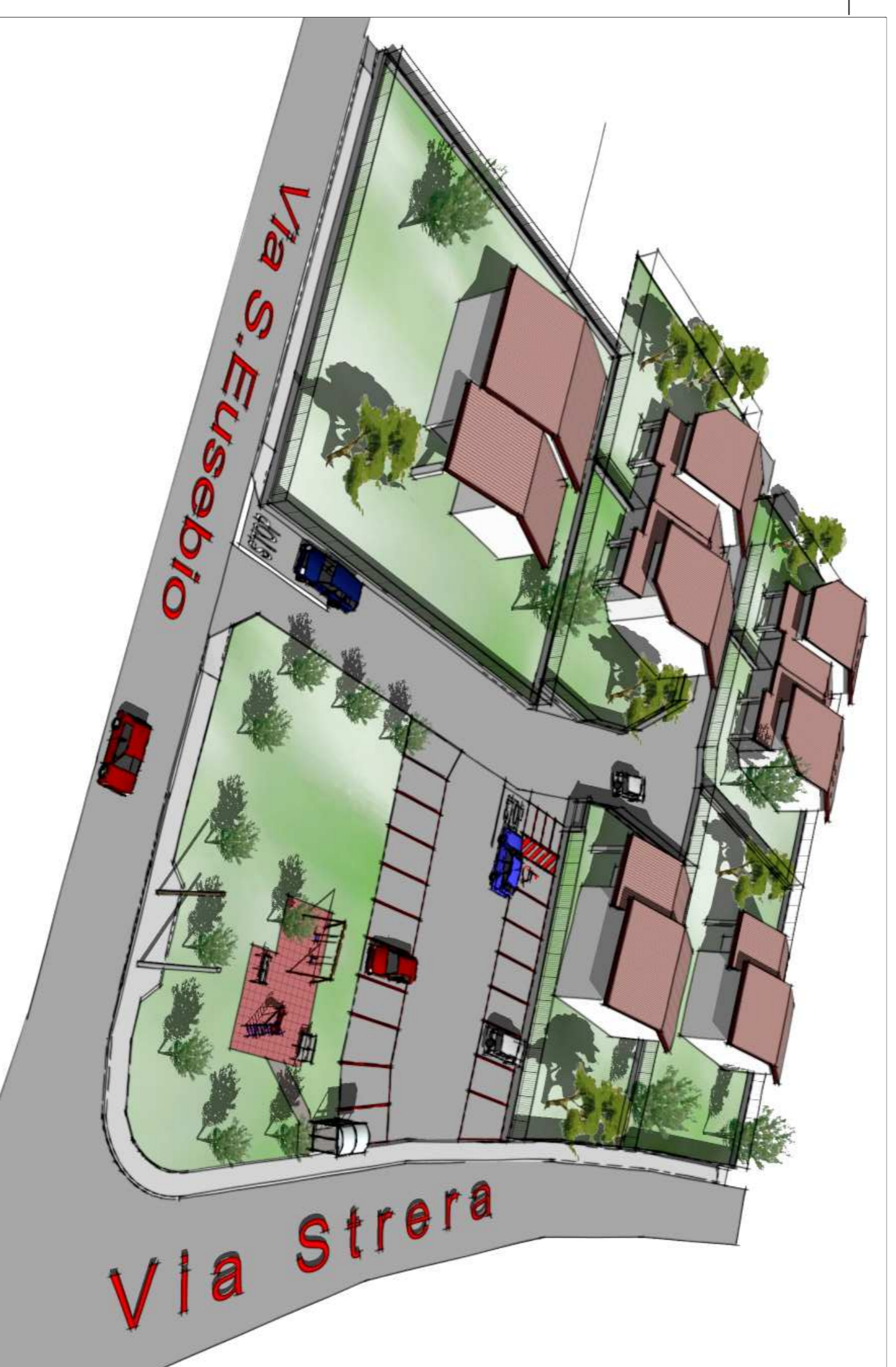
Plano – volumetrico